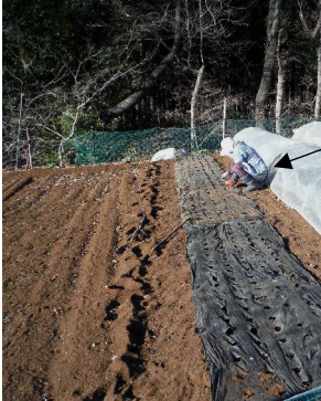
↑肥料を入れマルチを張り種を蒔く ノ種蒔き後に保温シートを張った。