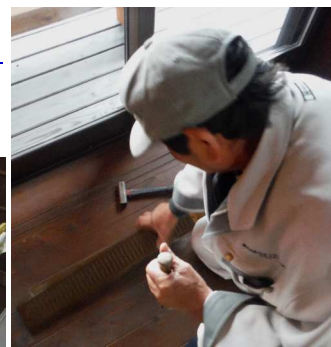
↑床からのOM吹き出し口のガタ つき、監督さんがノミを使って ピッタリ調整、プロは手早い。