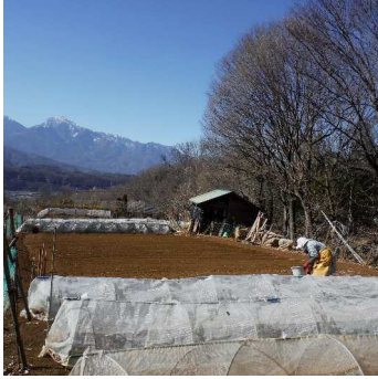
↑02.03甲斐駒ヶ岳の雪白く。力 カ一人でハウレン草畝作りをする