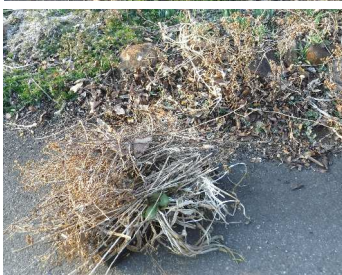
↑03.15カカはお宿前の畑で、野菜からネットを外す、←トトは花壇の枯草を切り取り、春の準備。→桜草が咲きだしクロッカスも顔を出す