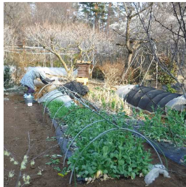
↑お宿前の野菜畝、極早生菜花は立ち枯れ、菜花も丈が伸び、花先を摘んで食べ、いずれ抜いて耕し夏野菜作りの季節に。

を・・・22日一日雪が降り翌日に雪も残り、お宿前の菜花も積雪で押しつぶされてしまいます。