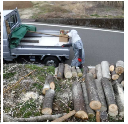
↑03.19「切り倒しておいたヨ」暮れに知人から言われ、三カ月たって雪降る前に腰を上げた。薪材は椋に桑や山桜など、平茸とナメコの種菌を打込む予定。

田舎暮らしは、おいしく楽しい。ブツブツ言いながら耕作放棄地の切り倒した雑木を、薪材に切るトト。だまって切った70cmほどの薪材を、足元のツルや枯れ木を確かめながら運び出すカカ。「木耳が生えてるヨ!!」ポジティブなカカは観察力もスゴイ。おかげで夕飯はキクラゲと春雨の炒め煮、ワケギの食感も捨てがたい。