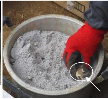
種芋の切り口を木灰で↑腐敗防止