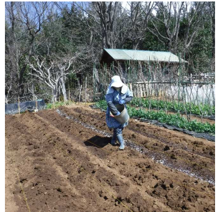
↑03.18ジャガイモの「キタアカリ」の畝作り、トトが畝切りカカ肥料をまく。

ジャガイモは色々な料理に使えるが、年明けまで保存すると水分が抜けシワシワに、保存には発芽が遅い「十勝こがね」を。毎年春分が近づくと天気予報をみてジャガイモの植付けをする。今年は3月21日に雪が降る変な気候、発芽する四月下旬の遅霜が心配です。