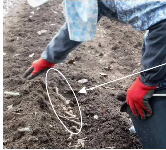
→03.16大和芋を1畝植えた。 ↓芋の成長点を畝の溝に置いてゆく

猪に食べられ全滅しかけた大和芋、手のひらの形から手芋とも言われ、粘りが強く摺り下ろしトロロ汁や、焼き海苔で巻き磯辺揚げなどに。猪が掘っても食べなかった蒟蒻芋、昨年の長雨で出来悪く今年に期待をしたい。蒟蒻芋は皮を剥きサイコロ状にカットし、計量パック詰めで冷凍保存をして置けば、コンニャク作りも手軽に出来ます。