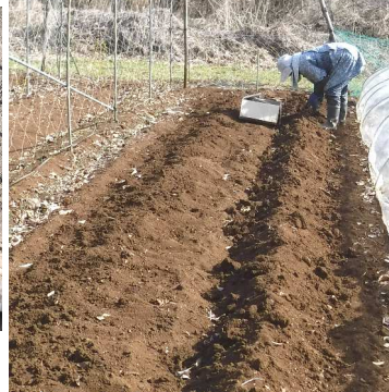
↑03.18先日の大和芋の隣畝に高畝を作り、コンニャク芋を植えた。