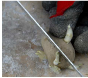
↑03.16「インカのめざめ」 ↓「アンデスレッド」の種芋の芽を確かめ切り分ける。芽は欠け易く、少ない芋もある