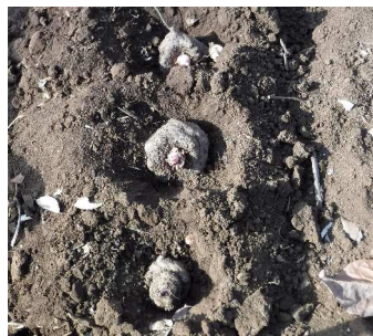
03.18ノ大きい芋から45度ほどに傾け置き、高畝に土を戻す。 ←親芋に付いていた子芋(気子)4年後には手作りコンニャクを?