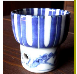
高台に↑穴がある盃、紐を通し首に下げ、お花見客から貰い酒?

春分・末候3月30~4月4日「雷乃発声かみなりすなわちこえをはっす」春の訪れを告げる雷が鳴り始める頃という意味である。雷は「イカズチ」とも呼ばれる。自然が起こす放電現象で、このとき放射される光を雷光ないしは稲光、稲妻、その音を雷鳴という。稲妻の名は雷の光が稲を突らせると信じられたことにより、「稲の夫(つま)」を