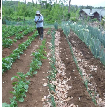
友に買った長ネギ苗も植えた→