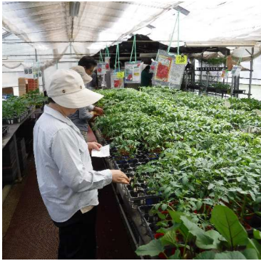
↑04.29毎年行く苗屋で色々な苗を買い、買ったナス苗を林の開墾畑に植えた。種から育てた自家製苗も畑に植えた。