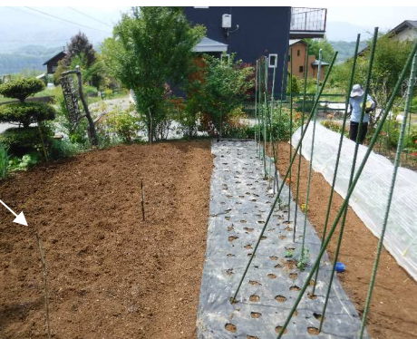
↑ピーナツ種時く、トマト苗↑ノレタス畝