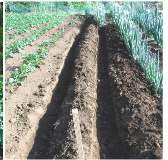
←04.30お宿前の畑で種から育てた長ネギ苗を掘り ↑長ネギ植えの畝も掘り ↓長ネギ苗を植え落葉を埋め込み終る。