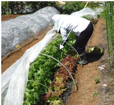
↑05.06移植し育ったレタス類、 小ぶりですが収穫できるまでに。