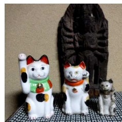
小さな招き猫も居ます お宿ミニギャラリーに

立夏・初候5月5~9日 「蛙始鳴 かえる はじめてな く」野原や水田でカエルが 鳴きはじめる頃という意 味。カエルはカワズとも呼 ばれ、日本で最も目にする 機会が多い両生類である。 世界全体で4000種類いる なか、日本には40種前後 が生息している。カエルの 鳴き声は初夏 の風物詩である。江戸時 代にはカ シカガ エルの