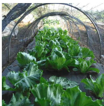
↑05.05レタスも畑に移植し1カ 月ほど、少しづつ育っています。

厳しい寒さを乗り 越えたレタス類も5 月で終りに、2月下 旬に畑へ直播きした レタス類や、3月初 旬にポット蒔きしたレ タス類が順調に発芽、畑へ 移植し育っています。