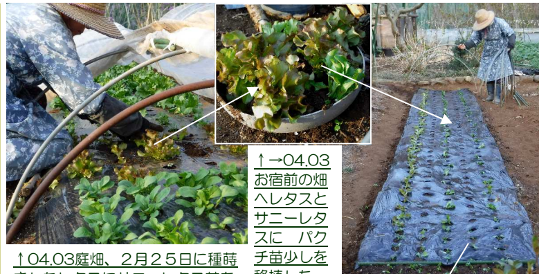
↑→04.03 お宿前の畑 へレタスと サニーレタ スに パク チ苗少しを 移植した。