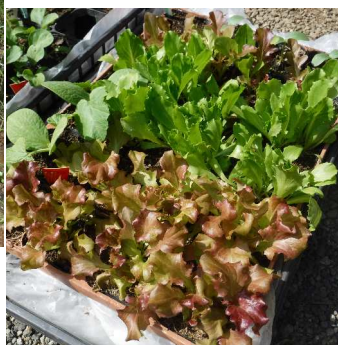
↑05.06 3月3日ポットに種蒔 きし、育ったレタス類の苗。