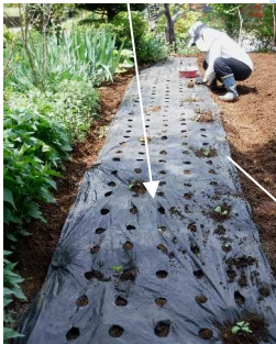
↑05.03長ネギ苗後に自家製ナス苗植えた。