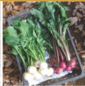
↑キレイにしたカブと赤カブ、柔らかく漬漬でオイシイですよ