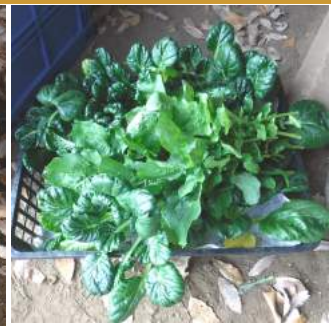
↑ター菜は炒め物に味噌汁の具にも、ルッコラはサラダにグ〜!