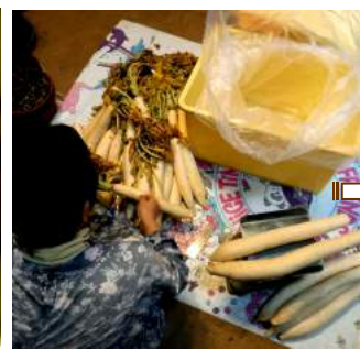
11.19天日干し大根を計量し→ △砂糖・辛子・塩を混ぜて入れ ↓酢を回しがけし重石をする