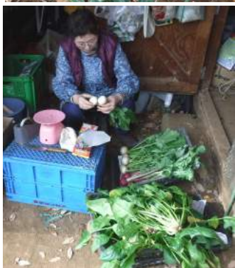
↑カブのチェックと計量袋詰め、甘味があるホウレン草も

暖かな初冬から一変し、初雪の後に雨や降霜などで体調が追いつかない。野菜も同じ霜の降りる前にトンネルネットを張り、雪の予報を見てはネットを重ねて防寒対策、畑仕事をカレンダーにメモ書きし、昨今の頃は？作業暦を見ては早め早めに作業計画を立てるが？力カの仕事は忙しく。