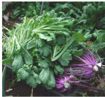
↑水菜・大葉春菊・紅水菜も収穫。