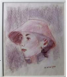
↑小磯良平 パステル画 1903-1988 神戸市生まれ 藤田嗣治らと従軍画家として中国に渡る。

お宿の絵を架け替えました。今は女性の横顔「目は口ほどに物を言い」眼チカラなどとも、描かれた時は何を想っていたのか? タイトルの無い絵もあり不明。