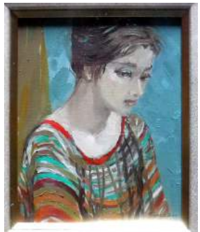
←「髪をあげた人ひと」 油彩 古川玉枝 光風会会員

お宿の絵を架け替えました。今は女性の横顔「目は口ほどに物を言い」眼チカラなどとも、描かれた時は何を想っていたのか? タイトルの無い絵もあり不明。