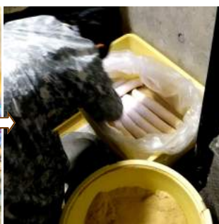
又カで沢庵30kgを漬け込む ↓11.26白菜を漬ける。これに キムチ調味料でキムチ漬にも!!