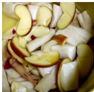
↑11.07大根アップル漬を作る ↓11.24酢辛子沢庵を漬ける。 干し大根をタルに丸く詰めて→