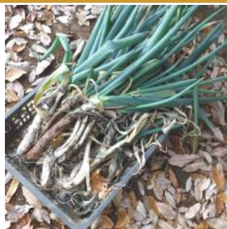
↑長ネギが柔らかく美味しい冬が来た!! ←12.07畑で野菜収穫中、これからの寒さに向けて防寒対策の真っ最中。