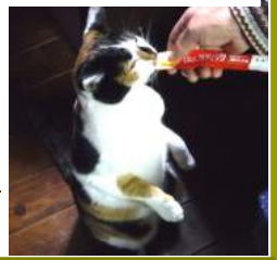
ハイご褒美は 正しい姿勢で 12.07撮影

山梨県北杜市明野町で「雨と風と太陽と」 「土と人情」に囲まれた。ナナミ ちゃんの「私、土の子」奮闘記