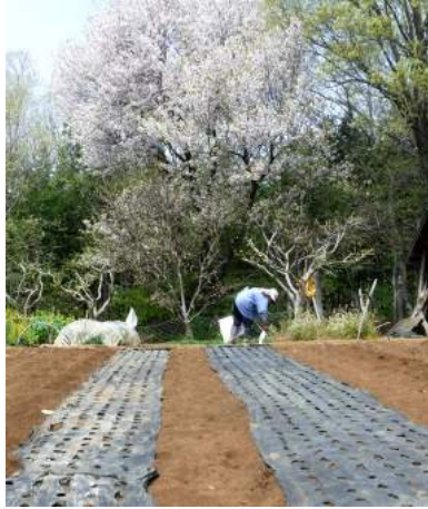
↑04.23前号で植えた長ネギ畝の隣に コンニャク芋1畝とササゲ豆2畝を作り、 ↑島オクラ種も蒔き ↑トウモロコシ (ゴールドラッシュ)1畝を4分割し、 次々育つよう1回分を蒔いた。

4月下旬は山桜の季節、畑の山桜も咲きコナラなど並木の萌木と錦織なす。日照り続き、月末頃に少し降雨がありました。気温が零下に下がり薄氷もはり、夏日だったり冬日になったり、植えたばかりの野菜苗や、やっと芽が出たジャガイモなど霜対策に大わらわの力。