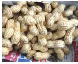
↑自家採種のピーナツ種 →大粒落花生おおまさり1袋を買って蒔き種袋を土に挿し、 続けて自家採種豆を蒔く、昨年は不作でした。