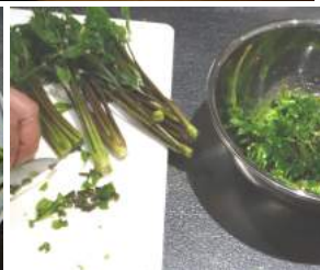
↑04.26コシアブラご飯作り