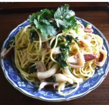
←畑のパクチーと赤イカを使ってオリーブオイルスパゲティを作る。赤イカの歯応えとパクチーの香りがスパゲティに旨味を添え