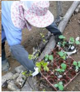
↑種から育てたキュウリ苗