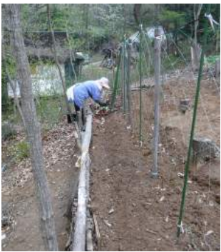
←04.21カカが種から育てたキュウリ苗8本を、大和芋を植えた畝の先に植える→。林畑は母屋の北側なので半日陰、キュウリや生姜には良い場所、他にも栗カボチャ苗を植えモロッコインゲンも蒔きました。