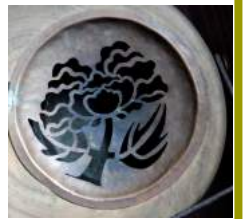
古い煙草盆の火入、銅板で牡丹柄を切抜き灰皿に、トトの自信作。

穀雨・末候4月30～5月4日「牡丹華 ぼたんはなさく」牡丹の花が咲き出す頃という意味。中国から日本には平安時代にもたらされ、宮廷や寺院で観賞用に栽培されたほか、その根皮に消炎や止血などの効果があると