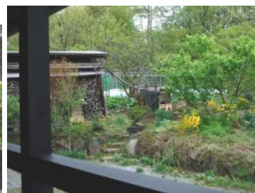
04.26お宿の庭は、萌木色の初夏へ