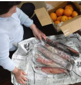
↑04.12三宅島から釣り上げたばかり、肉厚の刺身用赤イカと甘夏柑が届いた。→甘夏柑は口直しに