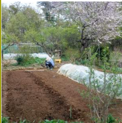
ナナミちゃんのお宿前の畑、冬野菜のホウレン草や小松菜を抜き耕す。04.24 カ力は山桜の下に座り、自家採種のピーナツの殻を割り種豆作り、桜吹雪舞う。