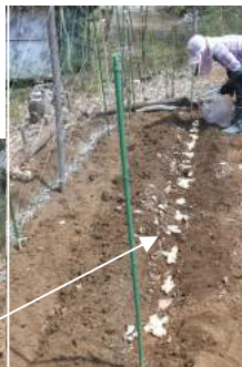
←04.19大和芋を植えた隣に畝を掘り、↑生姜を植えた。新生姜が楽しみ!!