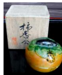
香合「柿にテントウムシ」畑も暑くなりテントウムシ出始め

小満・初候5月21～25日「蚕起食桑 かいこおこってくわをはむ」蚕が桑の葉を盛んに食べ始める頃という意味。その吐く糸でつくられるのが繭で、中国や日本では古くから、絹糸を採取していた。