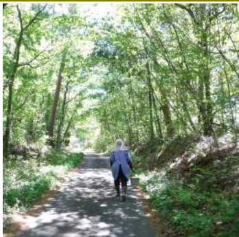
↑畑へと毎日かよう雑木林の道

毎朝、庭畑のズッキーニの受粉をして絹サヤの収穫、次に畑まで歩いて行きスナップエンドウなどの収穫、夕方には畑と庭と林の畑で水遣り、原木椎茸などにも水遣り。天気予報で降雨と知れば、庭畑の野菜やブルーベリーに追肥をしているカカ様にありがとう。