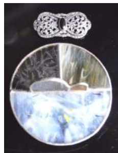
↑↓今月買った、銀のブローチと用途不明のスタンドグラス細工?