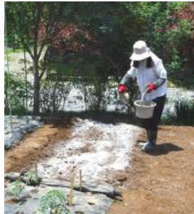
↑③直ぐに苗植えをするので有機石灰と肥料をまく。