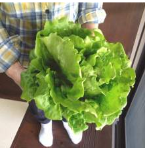
↑05.23初めて作った半結球レタス、クセ無く柔らかです