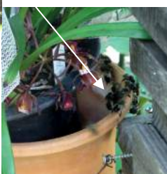
↑05.23白円の中、日本蜜蜂がキョウリンハンに群がり球状に。→キョウリンハンを入れた植木鉢に真っ黒で大きい雄蜂が十数匹も群がっている。

今回は雄蜂が10数匹も、雄蜂が居るといことは女王蜂も来ているか?!! 少数群なので第3か第4分封群、何とか居ついて欲しいです。