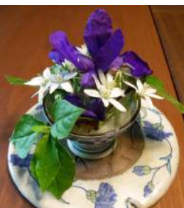
↑白花のハタケニラとアヤマ、ヤマツツシの葉