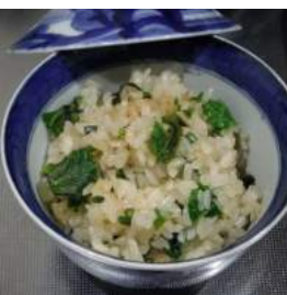
↑夕食にコシアブラご飯、今年しラストのご飯に。