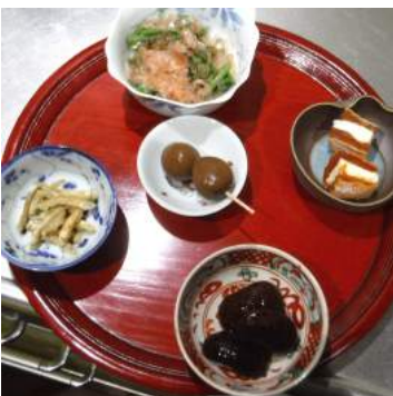
↑05.11花豆の甘露 ↑ 干し柿のクリームチーズサンド、ワラビのおひたし、味付けウズラ卵、素揚げワカサギを夕食前菜、冷酒でお召上がり