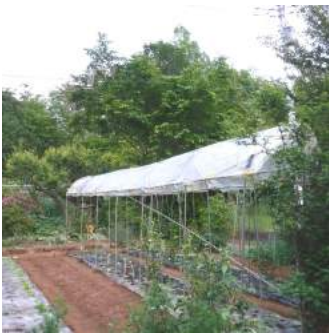
←⑨カカトトでビニール屋根を張った↑方にトマトフレーム完成、後は鳥除けネットを張る。