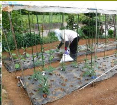
↑05.20雨が降る予報、ナス苗に追肥をほどこすカカ、手前のトマト苗にも