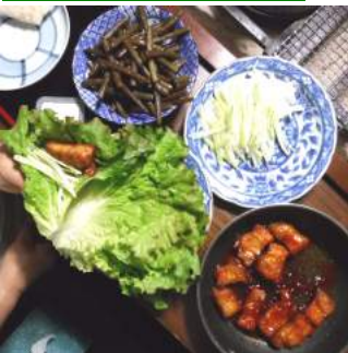
↑「レタスに長ネギと肉をのせて巻くの」聞いたばかりのレタスの食べ方、即! 実践するカカ

「こうしてレタスを食べたの」おいしいレタスの食べ方を伺ったカカ、豚肉をコッテリ甘ダレ味に仕上げ「こうやるのヨ」オオ〜旨いヨ、この会話が夫婦長持ちの秘訣か? この時期のフキは繊維が気にならずオイシイ。