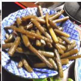
↑庭のフキを採り茹でて皮むき味付けをして、七輪でじっくりユックリ汁気が無くなるまで煮詰めた佃煮風。一本食べて二口グビッと、イケル味。

「こうしてレタスを食べたの」おいしいレタスの食べ方を伺ったカカ、豚肉をコッテリ甘ダレ味に仕上げ「こうやるのヨ」オオ〜旨いヨ、この会話が夫婦長持ちの秘訣か? この時期のフキは繊維が気にならずオイシイ。