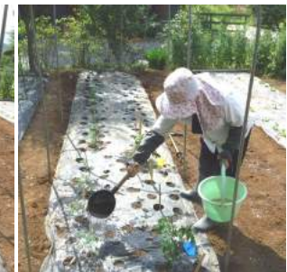
↑⑥ヒシャクで充分水遣りをして、カカの作業は終る。