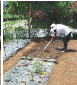
↑④クワで肥料などを土にすき込みマルチを張る。