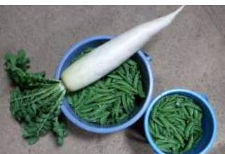
↑05.22畑で朝取り大根と毎朝収穫するスナップエンドウ。