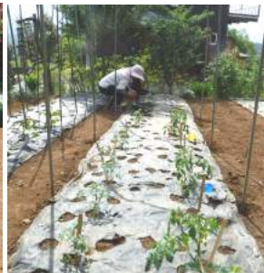
↑⑤育てていたトマト苗を、張ったマルチに移植する。