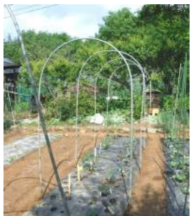
⑧開けた穴にフレームパイプを立てフレーム組立