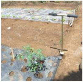
⑦トトは穴あけ器で作業