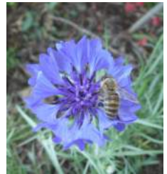
↑05.16庭の矢車草に日本蜜蜂が来た。

5月中旬に「待ち箱」へ来た日本蜜蜂は3日間ほどで飛び去り、カカトトはガッカリ・・・来るか来るかと毎日のぞいていたら「来た来た来たヨ!!」とカカ、キョウリンハンに誘われ群れている。