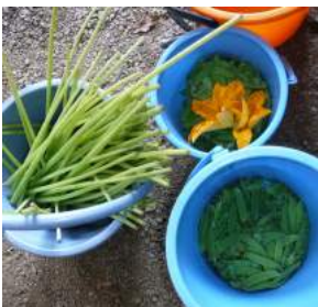
↑05.24煮物にする庭のフキと絹サヤ。オレンジ色の花はズッキーニの雄花、10時までに人工授粉をしている。