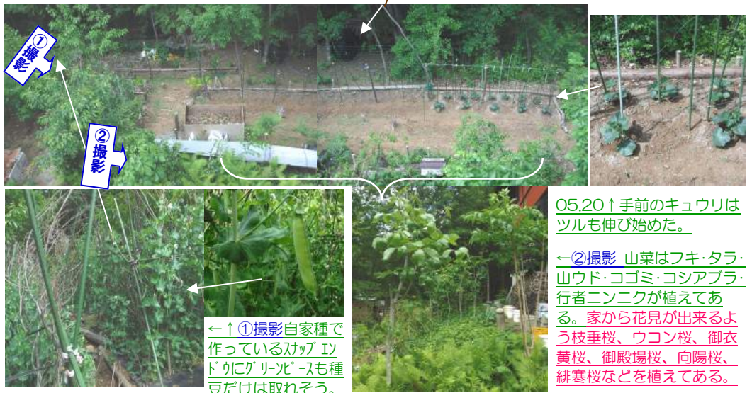
05.20↑手前のキュウリはツルも伸び始めた。