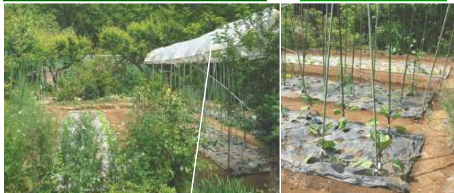
↑グリーンネットの中にはブルーベリー20本、今は花も咲き終わり小さな実がつき始め。ネットの手前にミツバ、あちらこちらにワラビが少し出ています。