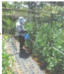
←絹サヤの収穫中、↓⑥撮影 ブドウ棚のすみにコールドキ足元のマルチに万願寺唐辛子とピーマンを植え、甘長唐辛子も27日に植えた。 ↓フキと道路の間にアズキと梅や小梅に甘柿などを植え、ミョウガとフキも育てています。