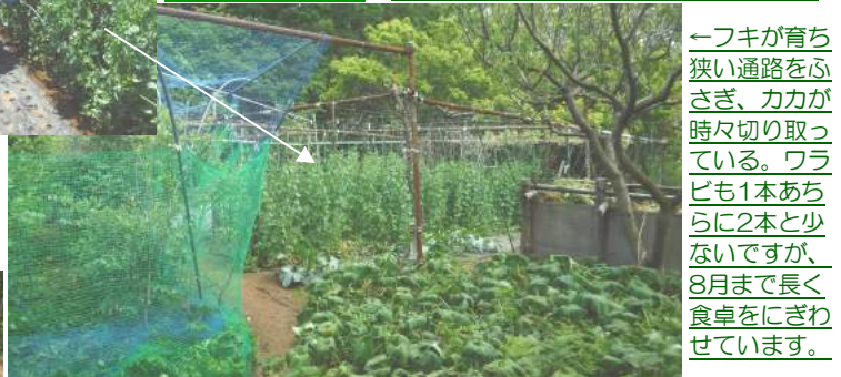
←フキが育ち狭い通路をふさぎ、カ力が時々切り取っている。ワラビも1本あちらに2本と少ないですが、8月まで長く食卓をにぎわせています。