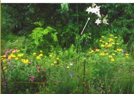
↑07.20赤はエキナセア、 黄はキクイモドキ(化北マリア) 青紫のキキョウも咲き始め 右上ピンク色のカサランカ ↓カサランカを支柱に固定