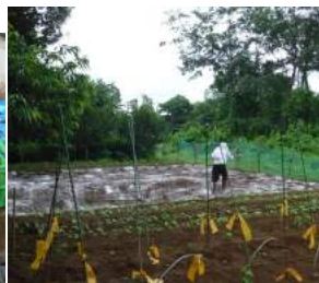
↑石灰などを散布し↓泥だら けになりながら耕し終わる。