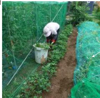
↑スイカが腐らぬようトレーを枕に。←雨がやめば草取りで忙しい

異常なほどの長雨。カカは毎朝、小雨でも庭畑に出てキュウリにインゲン、ズッキーニなどの収穫をする。日照不足と多湿のため野菜に病気になるが、夏野菜を絶やさぬよう畑を耕し苗を植えています。梅雨明けか?とおもえば午後から雷雨!! PC作業は中止。