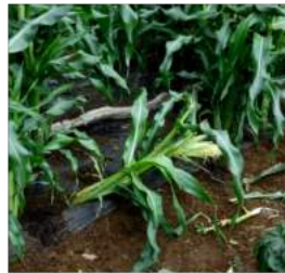
↑07.07カラス? トウモロコシが倒され実が突かれ→ネットを張ったが