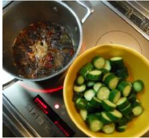
↑キュウリを生薑・唐辛子・山椒の実の煮汁に一晩漬けて ↓キュウリのPちゃん漬コリコリ歯応え