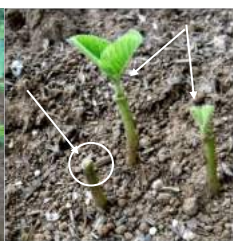
↑豆が割れ発芽、それ が双葉になり本葉が出 てくる。地上に現れた 双葉になる前を鳩が食 べて茎だけに!! その茎 から脇芽が出た2本、 カカは種豆を蒔き直し ています。