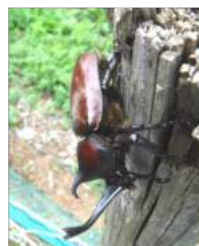
07.18カフトムシ 発見!! 畑の草取りで

大暑・初候7月23~27 日「桐始結花 きり はじめ て はなをむすぶ」桐の花が 咲き始めるころという意 味になる。桐は淡い紫色 の花を咲かせるのは5月初 めの頃。ここで言う「キ リ」は木 肌が緑色 の「アオ ギリ」薄 黄色の小 さな花を 房状につ ける。 「キリ」 発見!! 畑の草取りで