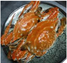
←知人から頂き物!!大きな「ワタリガニ」カカトト家族5人でムシャムシャ旨い!! 残った殻などを出汁にして味噌汁も作る。