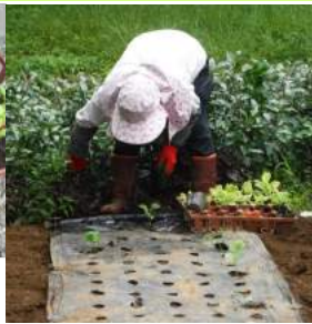
↑キュウリ苗から移植し支柱も立て、苗に水遣り