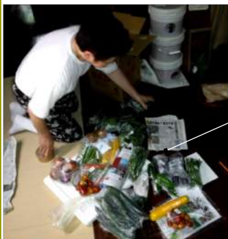
↑07.20お野菜宅配便、定期会 員様へカカの野菜を箱詰りする。