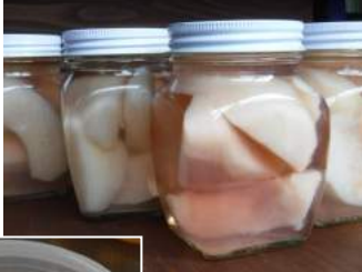
→頂き物の桃をコンポートにし、ゼリー寄せに冷やして桃ゼリー。