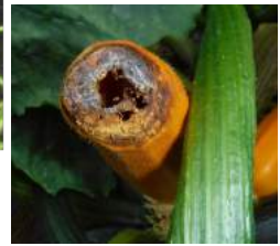
↓長雨でズッキーニの花が腐り実まで腐る、茎までダメになり抜くことに