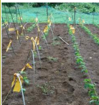
↑07.18晴大豆に丹波黒豆の 畝、鳩に豆を食べられ水系を 張ったり黄色の短冊を下げたり と、カカは育つまで大忙し。