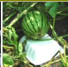
↑07.18長雨対策で スイカにトレーで枕を 晴れの日が 続かない梅雨 の長雨、野菜 の収穫もまま ならず耕すタ イミングも 無く、野菜 にも病気が 出始めた。カカは葉を切って風 通しを良くし、病気が広がら ないよう悪戦苦闘。トトは晴れた 途端に蒸し暑さでダウン寸前 に。