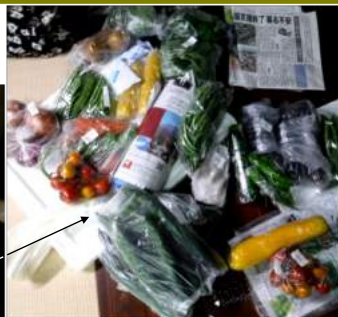
↑玉ネギ・キタアカリ・キュウリ・ 人参・トウモロコシ・モロッコイン ゲン・長ネギ・ピーマン・インゲン・ ナス・長ナス・ズッキーニ・トマト・ 万願寺唐辛子・茗荷・オカヒジキ・ モロヘイヤでした。