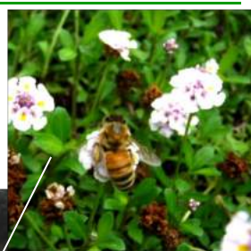
↑薄いピンク色 のイワダレソウ の花に蜜蜂が来 ていますーお宿 の駐車スペース に広がったイワ ダレソウ、花時 は6下~7下と長 く蜜蜂の羽音が たえないグラン ドカバーです。

六月はタメ息をつくほ ど一時忙しく、七月に 入ってタメ息も出ぬほど 暇。長雨で畑に出よう にも出られず、伸び放題の