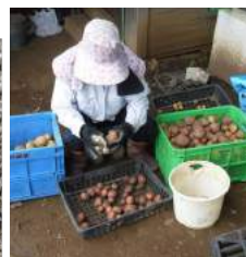
↑残っていたジャガ イモを掘り ↓大根も 抜き小雨の中、耕す