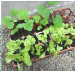
←07.21畑に肥料を入れる↑キュウリとレタスのポット苗をマルチを張って移植する