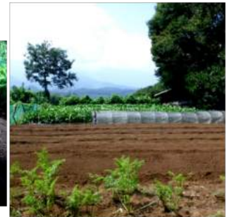
↑ブロッコリー、青首大根2種と紅芯大根に漬物大根を蒔く ↑手前は人参の葉