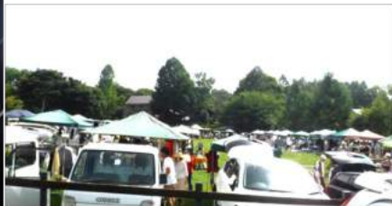
↓トトはカカの足先にある版画を¥2500円で買ったが、安かったのか? でも面白い!!

↑08.18 次回は9月8日と10月13日 9-13時で入場無料。「カーブツセール」で検索→カカはブリキのパケツを、持参したミニトマト1袋と交換で¥300円に。