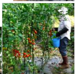
↑08.25庭畑の脇芽で増やしたトマトがテン? 小動物に食い荒らされ、←穴だらけのネットを重ね、ライトも点けたが。