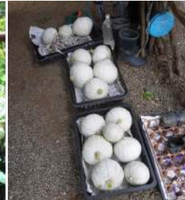
←08.27ブドウ棚で育てた伯爵カボチャの収穫 ↑今年はマズマズの出来