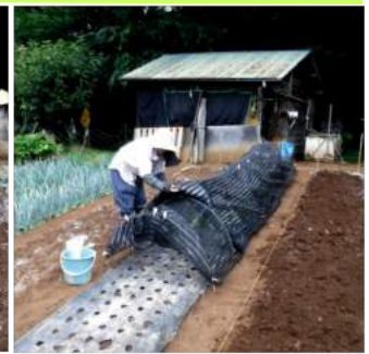
↑植えた白菜苗に日除けネットを