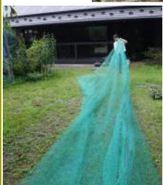
→収穫が終わったブルーベリー区画の草取り↑ネット外し片付け