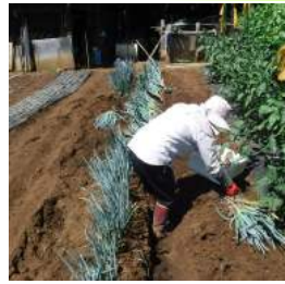
↑08.24畑の長ネギを移植して、白菜畝を広げる