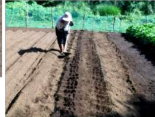
↑大根類の種蒔く畝作り