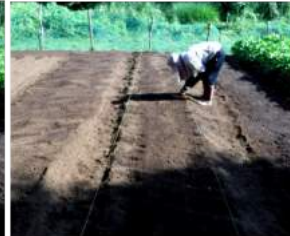
↑青首大根の種2粒づつ蒔く