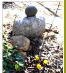
02.08キキの↑墓前に福寿草が三輪咲き、命日を告げる。

立春・末候2月13～17日「魚上氷 うおこおりにあがる」淡水魚は冬の間、水の底でじっとしている。春を迎え、水温が上がってくるのを待って