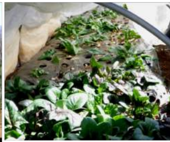
←02.09お宿前の畝でホウレン草の収穫、↑育った株だけを間引くように収穫、だいぶ減ってきた。