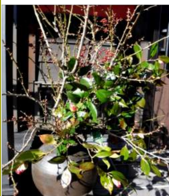
02.02薔の椿と梅の剪定枝、赤い実は南天、庭の花を玄関先に。