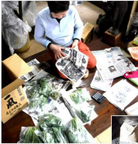
↑02.10お野菜会員へ午前中に箱詰め、農事通信なども入れて発送