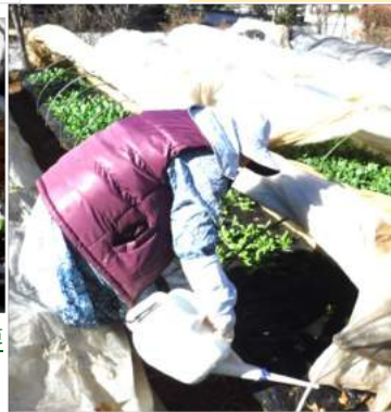
↑いくつもの畝の重ねたシートを開き、野菜に液肥を遣っている。