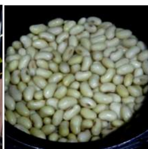
←豆の甘味かんじる大粒の曙大豆ご飯、豆の旨味がモチ米に染みて。→漬物に沢庵の生姜漬、赤カブ甘酢漬、切干しハリハリ漬、カブ浅漬などカカの手作り