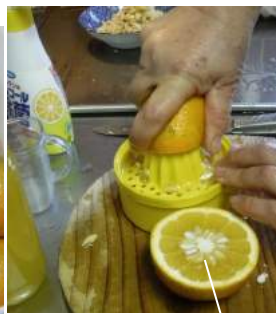
↑橙果汁をしぼり器でとる