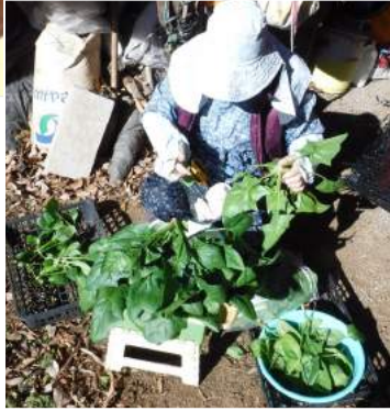
←02.09明日の宅配野菜を収穫 ↑収穫したホウレン草など葉物野菜を選別し、計量袋詰めをして明日の発送の準備をする。↓育った株を選びランチなどの食材に使っている