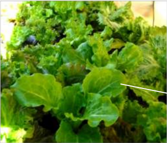
↑02.09庭畑のレタス畝、サニーレタスにレタスと半結球レタスが寒さの中、少しづつ育っている。