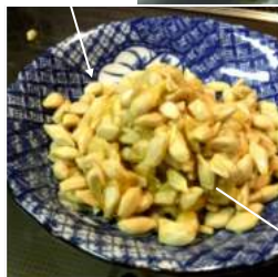
↑種は集めて焼酎漬けにし、種のヌルヌルを利用した化粧水を作る。

「ワァ〜ア箱一杯」一月中旬に三宅島から橙が届いた。無駄には出来ないのので、果汁を搾り食酢を少し足して果実酢を作った。島で獲れた赤イカをボイルし、醤油に果実酢をいれ食べたら!! 旨い。種はホワイトリカーに漬け保存し必要の都度、尿素と混ぜて化粧水作り。