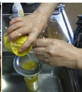
↑しぼった果汁を味噌こし網で種などを、取り除き果汁を瓶詰めし→商品ラベルを作成し、小瓶2本と500ml瓶5本を作った。酢の物や焼きソバなどにチョイ足し酸味!!