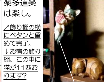
↑飾り棚の横にパタンと留めて完了。 ↓お宿の飾り棚、この中に猫が11匹おります?

①平置きの小物を100円で買って ②縦置きにするため ③裏に両面マジックテープを貼る。