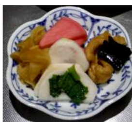
↓少しほろ苦く、薔がプチプチと菜の花の辛し和え