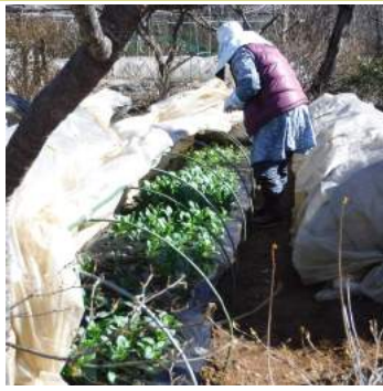
↑02.09小松菜に水菜やチンゲン菜など小さいが、シートを重ね育ててゆく。