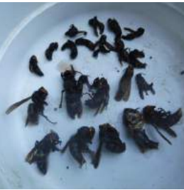
↑大きい蜂はコガタスズメバチ、上段も小さな蜂だが不明。