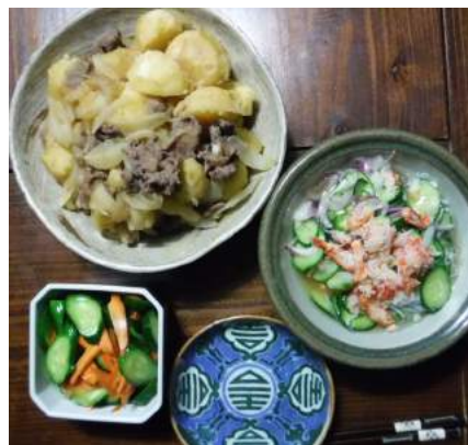
←06.13メインは「肉ジャガ」夕食、収穫が始まったキュウリと春雨酢の物に蟹ソボロを乗せて、キュウリに人參浅漬け。 →06.15キュウリがメイン、グリーンピースご飯に蒸し鶏、甘い玉子焼きの昼食

六月も後半になると、食事に登場する野菜にも変化が、葉物は無くなりジャガイモを掘れば食卓に、キュウリの収穫が始まれば酢の物や漬物にサラダなどと続き、6月も後半になってナスが登場すると、夏シーズンの開幕。今年は、どのような夏になりますことやら?