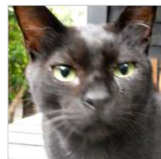
06.22オレのことキキ太だって、飯くれヨ

夏至・初頃6月21～25日「乃東枯ないとうかるる」「乃東」とは夏枯草の古名で、現在ではウツボグサ(靱草)とも呼ばれる。ウツボグサの花穂が黒ずんで、枯れたように見える頃という意味。花穂とは穂のような形で咲くことをいう。