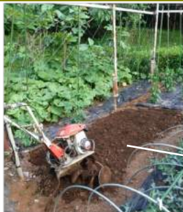
↑06.08小さなスペース を耕し →06.12サニーレ タス苗を植えた。