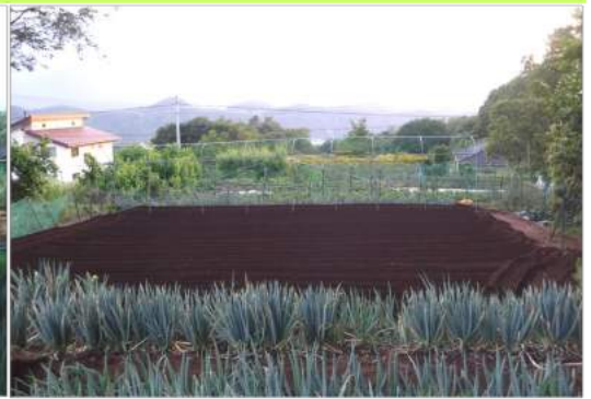
↑日没の残照で山や木立の梢がかすみ、やっと耕し終わるころ、力加は収穫で歯が抜けたような、いくつもの長ネギ畝を整理し、まばらな畝の長ネギを掘り、新たに掘った畝に植え直す。歯抜けを整理して次の野菜を育てる場所を、少しでも確保するための作業。これで四角い畑が維持できます。