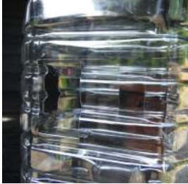
↑トラップ2型は、進入口を縦長四角を四面に開けた。