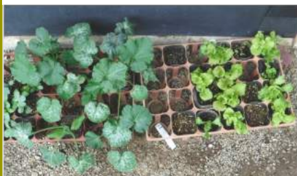
↑遅れたモロヘイヤ・スイカ・ズッキーニと サニーレタスの苗を、庭畑に植え終わる。