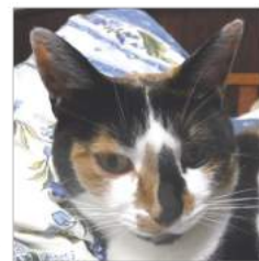
アタイは ハナよ 06.23撮影

山梨県北杜市明野町で「雨と風と太陽と」 「土と人情」に囲まれた。ナナミ ちゃんの「私、土の子」奮闘記