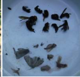
↑捕虫の全て、コガタスズメバチと蛾やハエ

日本蜜蜂の天敵、小蟻にスムシ、スズメバチなどの対策をする季節。スズメバチにはペットボトルで、昔作った四角の進入口と、ネットで知った放射状にロート型の3タイプを作り、ブドウジュースと黒砂糖に焼酎、食酢を混合した誘引液で10日間、同じ高さ吊って実験、進入口の出来不出来は有るが、結果は左記のとおりになりました。オオスズメバチは網で生け捕り、ネズミ捕り粘着シートに貼り一網打尽の予定?