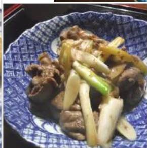
↑小芋の味噌転がしがメイン ↑牛肉と長ネギすき焼き風煮