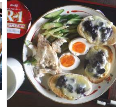
←06.21 ヨーグルトに牛乳、味噌汁、卵、蒸し鶏、パンにはブルーベリージャムとチーズこれでタンパク質4.5ポイント? 朝昼夕バランス良くネ