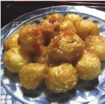
↑06.16新ジャガ小芋の皮つきをチン!!して素揚げ、甘味噌に転がして