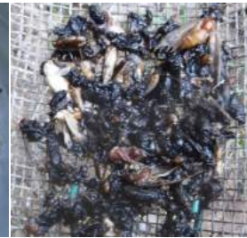
↑蛾とハエなど大量に入っていた。