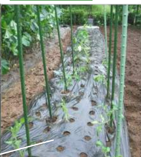
←↑06.14小雨の中、トマ ト挿し芽苗に支柱を立て、奥 にズッキーニ苗も植えた。

家の周りの小さな畑、冬から春の野菜を片付け、消石灰に苦土石灰と石灰窒素などをまき耕し、一週間ほど土となじませ、天気予報を見て!! 雨降る前が苗植えチャンス!! カカは庭畑へ、小雨降る中でも野菜苗を植えた。湿った土は長靴を泥んこにするのだが、寸暇を惜しまず働くカカ。