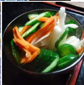
↑浅漬けは大根とキュウリに人參の三点夕食