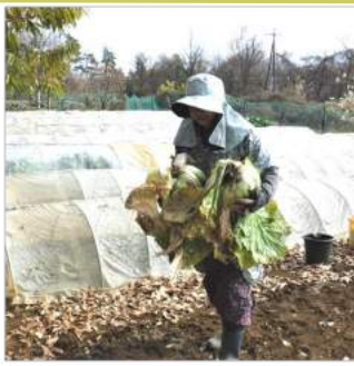
←12.09来週から零下の気温が続くので、急いで白菜を収穫することに、右側の白菜畝にはシートを重ねて防寒対策をする