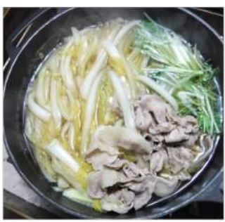
↑12.09白菜の白い部分をウドンに見立て縦切り、メン汁で豚肉と煮込む。水菜はサッと煮て椀に。↓煮汁が白菜にしみ意外と旨い。

寒さが来る前に白菜を収穫、簡単でおいしく食べるには?! 白菜の白さをウドンに見立て、シッカリ歯応えもあり葉の黄色い部分はやわらかく、腹持ちも悪くはないですよ。