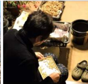
ノカカは毎晩、収穫した大豆の選別、一粒一粒チェックする。→12.09大豆の茎など焼却。