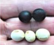
ノトの手 に丹波黒豆 と曙大豆 →12.04曙 大豆の収穫 を始める