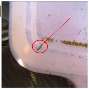
△12.07巣房の食いカスにスムシ発見!! さらに蓋にも1匹、寒くなくても巣箱の中は蜜蜂の熱で暖かい。今だに、屋外で飛んでいる蛾を見かけます。

冬を越すための給餌を、11月と12月で5回した。蜜蜂が巣の蜂蜜を食べ、空いた巣を噛み砕き箱の下に落ちている、そのカスを掃き出したらカスの中にスムシを発見!! 殺しましたが、蜜蜂に2カ所刺され腫れてしまいトホホ・・・です。