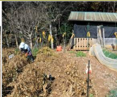
↑12.02カカト丹波黒豆3畝の収穫を始める。←作業車に腰かけ畝を進むカカ ↓豆の実付きは良い ↓茎から豆サヤだけを、もぎ取りバケツに入れて進む。