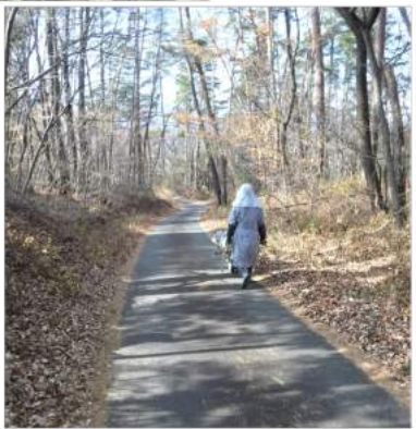
→一輪車に新聞紙で包んだ白菜を積み、家路を急ぐ力カ。凍らぬよう倉庫で白菜を保存し、煮物汁物漬物やキムチなどにする大事な保存野菜です。