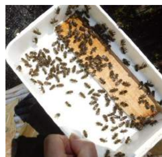
△11.25糖液を給餌、飲み切っても蜜蜂が群がっている。

冬を越すための給餌を、11月と12月で5回した。蜜蜂が巣の蜂蜜を食べ、空いた巣を噛み砕き箱の下に落ちている、そのカスを掃き出したらカスの中にスムシを発見!! 殺しましたが、蜜蜂に2カ所刺され腫れてしまいトホホ・・・です。