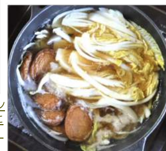
←昨日の煮汁も使いサツマアゲを入れ白菜ウドンと葉の黄色い部分を煮込む↓レタスと白菜のサラダに炒り卵をのせた昼食。

寒さが来る前に白菜を収穫、簡単でおいしく食べるには?! 白菜の白さをウドンに見立て、シッカリ歯応えもあり葉の黄色い部分はやわらかく、腹持ちも悪くはないですよ。