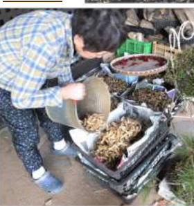
↑12.04収穫した豆サヤをカゴに入れ、日陰干しをする。直射日光で乾かすと、豆サヤだけが先に乾き割れ!!豆が弾け出てしまい、後始末に困ります。