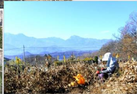
↑12.07落ち葉などを、空き袋に詰め、茎を抜き豆サヤをもぎ取りバケツに入れ前進。袋詰めをした落ち葉などは、長ネキ豆が弾け出してしまい、後始末に困ります。