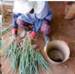
←04.20長ネギ苗を掘り ↑選別をして→左右 に長ネギ苗を植え終わ り、三畝目を掘り始める