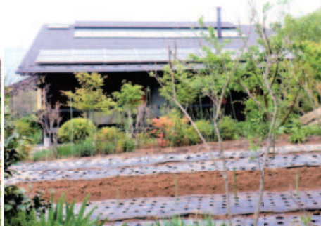
←↑04.25お宿前の畑は、冬野菜は無くなり夏野菜の苗などを植える準備が整いました。