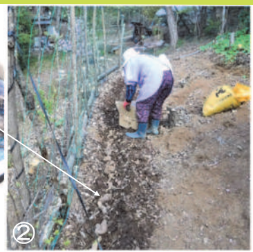
↑②畝にゲンコツ芋を置いてゆき、植付の間隔を決める。

桜咲く林畑は母屋の陰になって半日陰、狭く傾斜地なので甃壇状、その様な環境でも育ちそうな野菜を育てています。幸いなことは木々が風を防ぎ、庭畑なので水遣りや管理が小まめに出来ることでしょうか。食卓から野菜の成長を、観察できるのも何よりです。