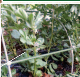
ノ04.20空豆 の細い莖を間 引いて、風通 し良くする力 カ。今年は大 胆に切った が? 良い豆が 収穫出来るこ とを願う。