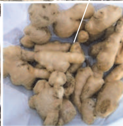
04.07 \ ③自家採種の里芋をゲンコツ芋の隣に植える。昨年は何とか自家消費分は収穫できた。 ↑④一番端に市販の種生姜を、沢山の腐葉土を入れて植え、収穫が楽しみ。