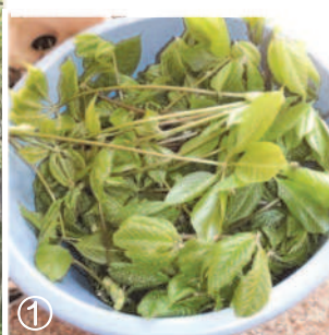
①採ったコシアブラ若葉、ご飯は若葉を使い、茎は天ぷらに。 ↓④モチモチご飯は三つ葉かセリのような味と香りです。