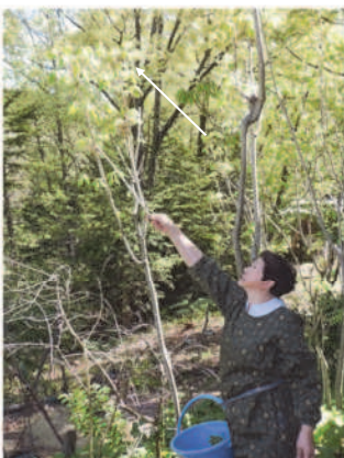
↑04.22コシアブラを採るカカ ↓③炊いた茶飯に刻んだコシアブラを、手早く混ぜ合わせる。