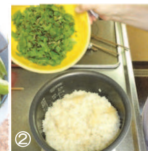
②炊き上がった茶飯はモチ米2合と米1合、刻んだ若葉100gを入れる。

山菜の女王とも呼ばれるコシアブラ、4月11日の「山菜 天ぷらうどん」で初登場、24日には茎だけを使った「天ぷらソバ」、この時の若葉は冷蔵保存をして、後日ご飯の食材になります。コシアブラの葉が食用に適するのは2週間ほど、前号で登場した山菜も旬は短いですが、四季折々に色々な物が登場して田舎暮らしは美味しいですヨ。