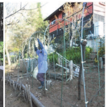
↑04.11昨年ここに落花生を育てた。今年はインゲン用のパイプフレームを立て、04.18パイプフレームにはインゲンの種を蒔いた。