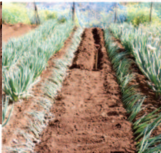
ノ狭く最初から3畝を掘る 畝幅が狭く、 両側を植え終 わってから、 掘り上げた土 の置き場を確 保して↓3畝 目に苗を植え える力カ。