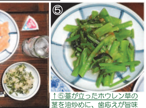
↑⑤臺が立ったホウレン草の茎を油炒めに、歯応えが旨味