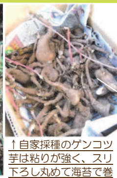
↑自家採種のゲンコツ芋は粘りが強く、スリ下ろし丸めて海苔で巻き、磯部揚げにも出来て旨味もある芋です。