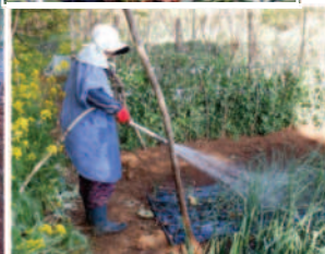
ノ04.20揚 水ポンプで水 路から水を上 げて水遣り。 →ポンプが活 躍する日照り にならないよ うにと願う。