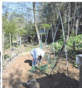
↑04.11ゲンコツ芋や里芋の隣にパイプを立てネットを張り、モロッコインゲンを蒔く準備中のカカ。