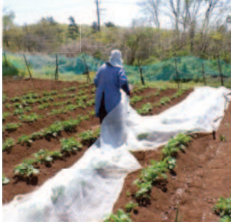
←04.20明野の景色 は花盛り、←↑被せて あったジャガイモの霜 除けネットを外す。

もう霜の降りる ことは無いと4月20 日に霜除けネットを 巻き取ったが、四月 下旬になっても寒暖 差が大きく霜の降り そうな日も、明日 26日は0℃の予報!! 過去にもゴールデン