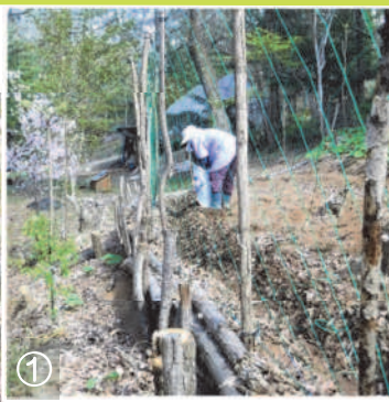
04.07 / ①林畑にネットを張り、腐葉土や肥料入れて畝作り。