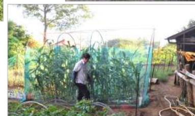
07.19トウモロコシも鳥とハクビシ ン除けにネットを二重に張った。

お宿も木の枝は伸び庭に雑草が生える。早め早めに少しづつ作業を進めないと、作業量も多くなり、剪定した後の枝や抜いた草の処分が一仕事になってしまふ。何事も先手先手と思うのですが、気力と体力が湧いてこない今日この頃です。