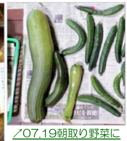
〳07.19朝取り野菜に収穫し忘れて大きくなったズッキーニが!!