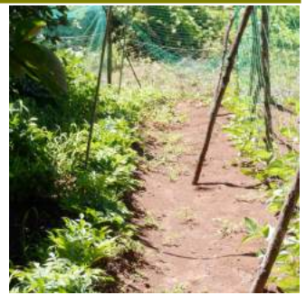
〳07.18先月23日に種蒔き↑をしたパンダ豆のツルも伸び↑コンニャク芋畝は雑草だらけ

梅雨で雑草は勢いづき伸び繁茂して、雑草取りに追われる日々。雨降るこの時期は、野菜に追肥をし、台風などに備え豆類やオクラなど、風で茎が倒れないように土寄せをする。寄せた土が茎を支え、更に肥料も株元に寄せられる。月末近くの台風8号来襲で一週間ほどは雨続きに、カカも朝取り野菜も雨に濡れ、雨が降れば雑草も伸び、ヘビ!!も這い出て来る・・・