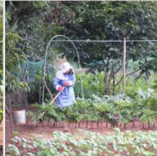
〳07.22オクラに土寄せをする