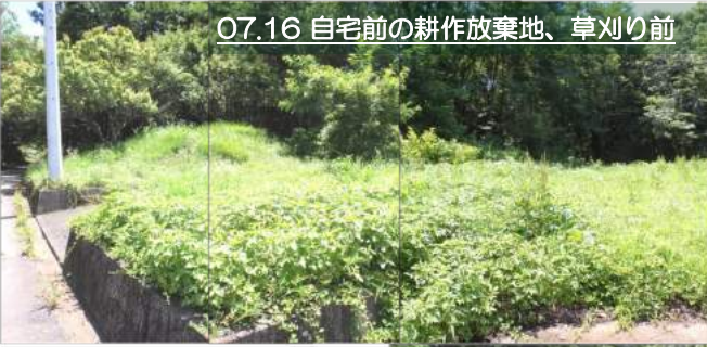
07.16 自宅前の耕作放棄地、草刈り前