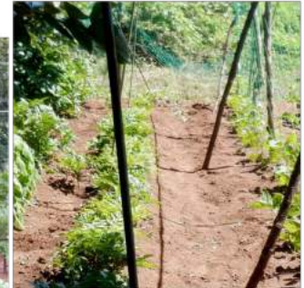
〳雑草を鎌で刈り取ってゆく。