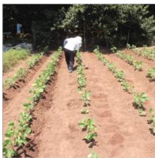
〳追肥が終われば土寄せをする