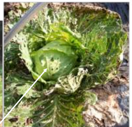
〳ササゲ豆畝の隣はキャベツ畝、無農薬なので↑キャベツは虫に食べられて穴だらけ。虫食いの葉を捨てると小さくなり自家用にしています。