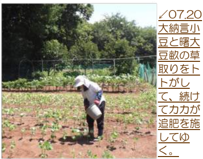
〳07.20大納言小豆と曙大豆畝の草取りをトトがして、続けてカカが追肥を施してゆく。