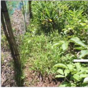
〳07.18畑の奥から草取り、ミョウガや山ウドに注意して