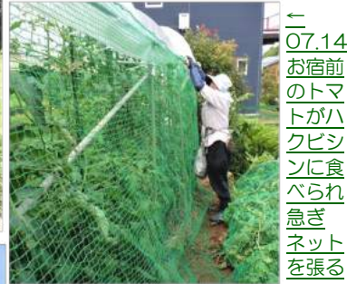
07.14 お宿前 のトマト がハクビ シンに食 べられ 急ぎ ネット を張る

梅雨入りから明けて8月上旬までは、適度に降雨があり雑草が繁茂する。耕作放棄地の草刈り、畑の草取りが忙しい時期。自宅前の梅林はニセアカシアが育ち、わが家の薪材の供給源。畑の隣地も耕作放棄地、地境の草刈りをしないと雑草の波に飲み込まれてしまう?! 「風の谷のナウシカ」腐海の森に…を思い出す、雑草との戦いは続く。