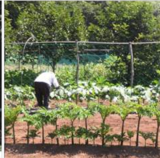
〳07.20春蒔き人参に追肥。↑オクラにも追肥をする。