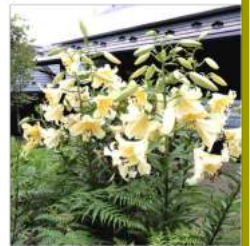
07.12玄関先の黄花オリエンタルユリ咲く。

7月22日「大暑たいしょ」暑さが最も厳しくなること。厳しい暑さをあらわす語でもあり、酷暑、極暑、烈暑も同じ意味である。夏至から数えて約一か月後、一年でも最も気温の高い季節となる。前