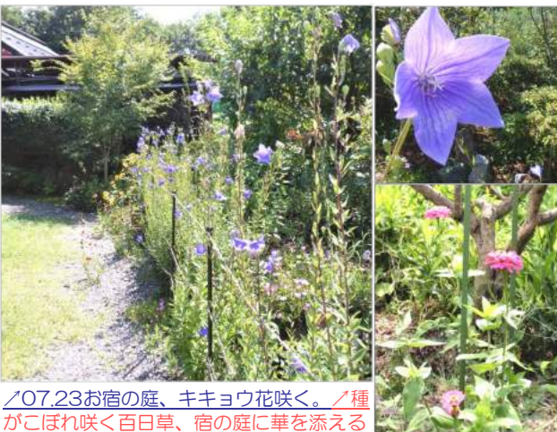
07.23お宿の庭、キキョウ花咲く。種 がこぼれ咲く百日草、宿の庭に華を添える