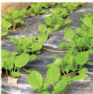
11.12↑花菜 ↓ノラボウが発芽