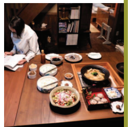
11.09囲炉裏の↑土鍋には明野の大根煮物。ハケ岳デイズ取材より

立冬・次候11月12～16日「地始凍ち はじめてこおる」大地が凍り始める頃という意味。霜柱ができて始める時期でもあり、空気中の水蒸気からできる霜とは違って、地中の水分が地表に染み出し、凍結してできる細い氷の柱の集まりのことをいう。日毎に寒さが募る時期になると、どうしても温かいものが食べなくなる。2001年、鍋つゆ製造業のヤマキが11月7日を「鍋の日」と定めたその日を選んだ理由は、立冬の日と重なることが多いのと、「いい日」な