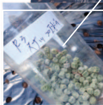
↑←10.30庭畑と同じスナップエンドウの種豆を、畑のサツマイモ後を耕して蒔いた。