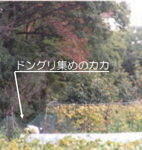
ドングリ集めの力カ