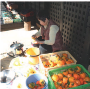
↑午後にかかが柿の皮むき、トト紐に吊るして熱湯へ入れ乾かし硫黄燻蒸、お宿縁側に吊る。

干し柿作り昨年は93個で今年は150個、昨年はマイマイガの毛虫などで不作でしたが、今年はマズマズの出来でした。冬の初めは畑仕事が忙しですが、食べなくては勿体ないと季節の味を作り続けています。干し柿煎餅も5日たち乾いて縮み干しザル1個になり。熟し柿のゼリー寄せは、柿の甘味がわかる茶菓子に。