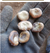
↑10.30畑に空豆の種豆を蒔く、カカ2列トト1列↓空豆も自家採取の種豆