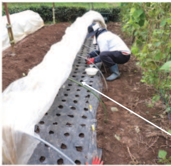
↑10.27庭畑、一週間前に種蒔きした花菜は発芽、ノラボウは発芽しなかったので種を蒔き直す。