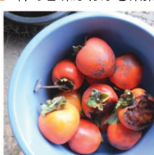
←熟し柿は捨てずに果肉を取り出しゼラチンと混ぜ合わせ冷蔵庫へ。→熟し柿ゼリー寄せ