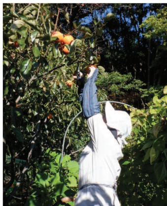
↑11.06渋柿の甲州百目と大蜂谷を収穫、↓今年は毛虫被害も無く2箱を収穫、昨年は1箱