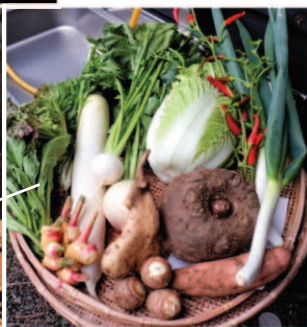
←①カメラマンとライターさんが、わが家の野菜を見ながら撮影イメージなどを打ち合わせ。→原木の椎茸と平茸も用意した。