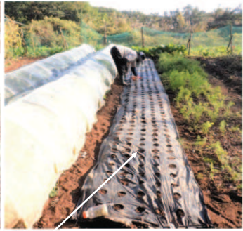
←10.30人参畝の隣にグリーンピースの種豆をマルチの真ん中に1列蒔く。