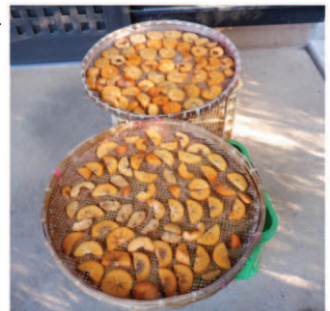
↑傷ついた柿や紐に吊るす枝の無い柿は、輪切りにして天日干して干し柿煎餅にする。

干し柿作り昨年は93個で今年は150個、昨年はマイマイガの毛虫などで不作でしたが、今年はマズマズの出来でした。冬の初めは畑仕事が忙しですが、食べなくては勿体ないと季節の味を作り続けています。干し柿煎餅も5日たち乾いて縮み干しザル1個になり。熟し柿のゼリー寄せは、柿の甘味がわかる茶菓子に。