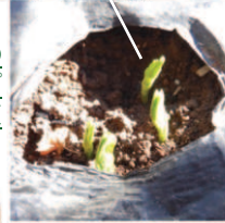
↑11.12スナップエンドウが発芽。