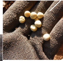
↑良い豆サヤの良い豆だけを選んだ、自家採取のグリーンピース種豆。