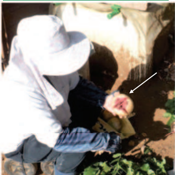
↘11.21紅芯大根を少し収穫、大きなモノは割れて、赤い中身が見える