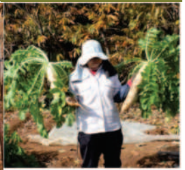
←11.18青首大根の収穫を始める。トトが抜き力は大根の選別と仕分けをする。↑大根の出来はマズマズと思ったが、中身に黒い筋が入った大根もあり、困ったナ。