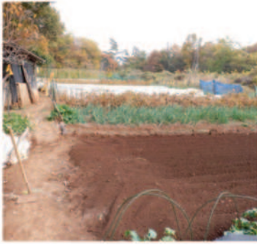
↑11.20紅芯大根を残して、青首大根は全て抜き終わる。←11.21落ち葉や枯葉を掃き取り、石灰三種を散布してから耕した。このまま春まで休眠。