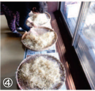
↑④11.26部屋干しをして仕上げ。乾き具合をチェック。