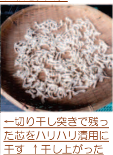
←切り干し突きで残った芯をハリハリ漬用に干す ↑干し上がった