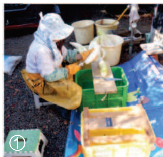
↑①11.20一回目の切干し作り、カカが水洗いをした大根を皮むきして手渡し、隣で受け取りトトが大根を突く。

今年は、切り干し大根作りが四回出来た。切干し作りは日中に日差しと微風があり、夜間零度以下にならないことが理想です。なかなか理想どうりにはならず、風強く木の葉が舞ったり、夜間零度以下になる日は布を被せたりと、乾くまでの世話に手間がかかります。ですが、長期保存が出来き、甘味や歯応えもあり、水で戻せる優れた食材です。