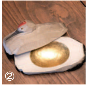
①木彫りの丹頂鶴 ②金箔を貼った香木入れ ③父島の海底にあったメノウの塊、便器のような形ですが、お香を楽しむのには最適です。