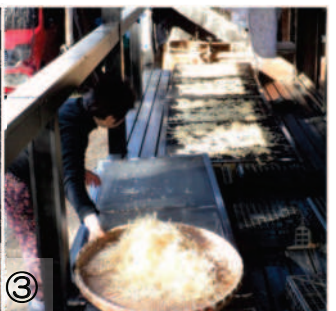
↑③11.24半乾きになった切り干し大根を、干しザルに移す。