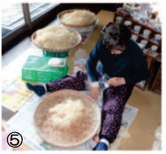
↑⑤12.01干し上がった切干しを、計量し袋詰めをする。