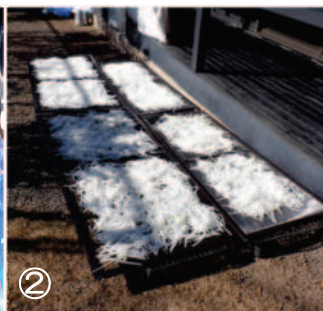
↑②突いた大根を専用の干し網に掛けて、天日干しをする。