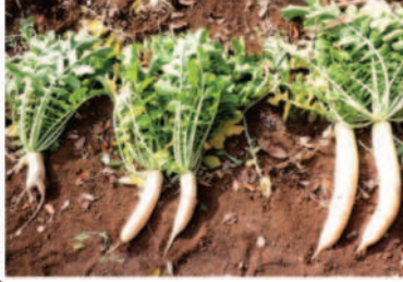
←左側の変形大根はカクテキ漬や煮物に、中央は沢庵用、右は保存用にす、カカが選別をして肥料の空き袋へ詰める。