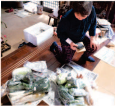
∟12.11お野菜会員へ宅配便、サニーレタス・ルッコラ・ホウレン草・長ネギ・青首大根・水菜・中葉春菊・ター菜・白菜・ブロッコリー・人参・アップル漬と梅干しに梅ジャムでした。