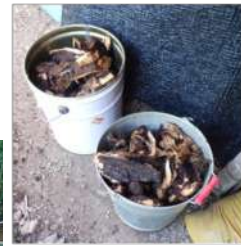
↑06.16掘り出した切り株の根、→切り株は残っているが今日は終わりに。→フキもワラビも消滅した・・・