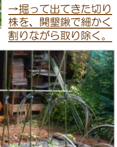
→掘って出てきた切り株を、開墾鋤で細かく割りながら取り除く。