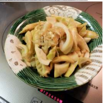
←06.05翌日、茹でた破竹筍を切って煮物に。甘皮をトッピング、柔らかな筍の食感と旬の味わい。