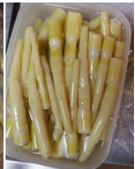
↑06.05島から届いた茹でた苦竹(女竹)煮物用に