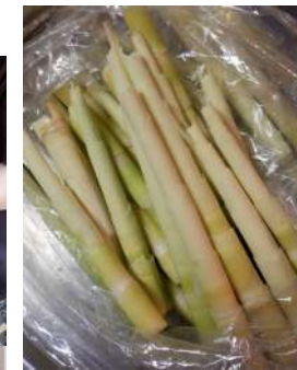
↑皮を剥いた生の苦竹、繊維質の噛み応えと苦味