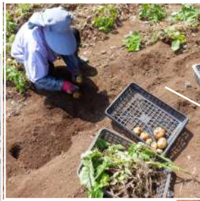
↑午後からカカト二人でジャガイモ掘り。キタアカリの収穫中