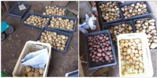
↑06.19午前中カカー一人で掘ったキタアカリに