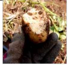
↑ネズミに食べられた芋、数は少なかった。

今年も五月に遅霜被害の心配がありました、無事に過ぎ収穫を迎えた。今年のアンデスレッドと十勝コガネは、芋が小さく収量も少なく、それに反して作付けの多いキタアカリは、芋が大きく収量も多く一安心。ジャガイモ三種ともに芋肌はキレイでした。ジャガイモ畝には肌をガサガサにする消石灰は、散布しないで作っています。カカトも歳を重ね、芋の作付けは少なくなっています。