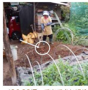
∠06.23掘って出てきた切り株は、16日の3倍に!! この土地が林だった頃に有った、コナラ伐採後の腐った切り株。