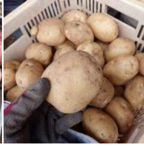
↑アンデスレッドは芋が小さく収量も少なかった。↑今年のキタアカリは、芋が大きすぎる物も有ったが収量は多かった。