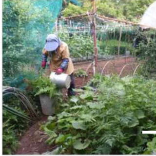
∠06.16庭畑の一角、フキとワラビを刈り取り始めた? どおするの? 「スイカ畝を広げるの」確かに狭いが。

隣地お宿の畑が無くなるので、その分だけ畑をどこかに!! 庭畑や畑のフキやミヨウガにワラビなどを掘り起し、移植をしたり廃棄したりと、畑を広げる涙ぐましい力カカ努力。いつまで広げた畑を維持できるのか? などとグズグズ考えずに、減った分だけ広げりゃいい!! と行動をする力カカ様。着いて行きます背中痛いト・・・