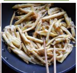
↑茹でた苦竹は甘辛味で、島を忘れさせない味