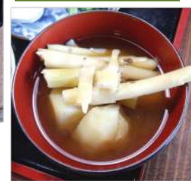
↑新ジャガと苦竹の味噌汁は、一番のご馳走!!