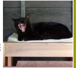
06.17風寝 台で大アク ビ!! キキ太

山梨県北杜市明野町で「雨と風と太陽と」 「土と人情」に囲まれた。ナナミ ちゃんの「私、土の子」奮闘記