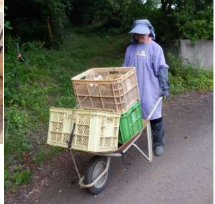
↑06.19収穫をしたジャガイモはケースに入れて、来年春まで母屋で保存をする。