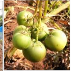
↑キタアカリに花が咲き実が、トマトに似ている。実の種を蒔けば小さなジャガイモが育つらしい?