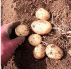
→十勝コガネを掘る、保存中も芽が出難く使い勝手も良い。↑小判に似た形状、今年の芋は小さく収量は少なかった。