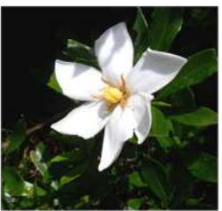
06.27 ←庭の生垣に咲くクチナシの花。

した気分を晴らすような幸福感に満ちた香りです。清楚な一重咲きと華やかな八重咲きがあり、香りは八重咲のほうが強いとされますが、秋に実が付くのは一重のほう。実は熟しても裂けずに、口が開かないことから「口無し」の名がついたと言われていました。橙色の実には古から染料や料理の色付けに用いられた。