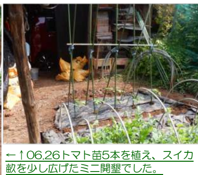
←↑06.26トマト苗5本を植え、スイカ畝を少し広げたミニ開墾でした。