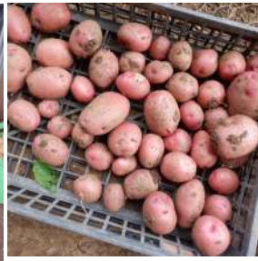
←収穫したジャガイモの土を落としコンテナに入れ自宅で保存。