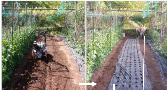
↑04.27菜花を抜いた畝を耕運機で耕し、肥料を施しマルチを張り →奥に種蒔き育てたサニーレタス苗を移植し、続けてズッキーニ・ピーマン・万願寺唐辛子の苗も植える予定。