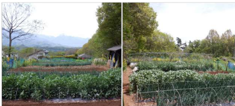
↑04.25西に甲斐駒ヶ岳を望む畑、手前に花咲く空豆畝、玉ネギ、長ネギとジャガイモ畝が広がる。ノ畑、東の茅が岳方向を望む、手前に玉ネギ、空豆、スナップエンドウと実エンドウ畝にコンニャク畝、渋柿3本、山ウドがある。

畑では冬越し野菜の白菜・キャベツ畝の後や薑立ちホウレン草に葉物を抜き野菜屑と落ち葉を集め堆肥枠に片付け。石灰類をまき耕運機で耕した。さらに薑立ちした春菊など葉物を抜き、耕し肥料を鋤き込み畝作り、シワシワになった自家用ジャガイモの十勝コガネを少し植えました。