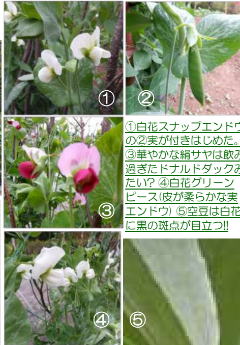
①白花スナップエンドウの②実が付きはじめた。③華やかな絹サヤは飲み過ぎたDonald Duckみたい? ④白花グリーンピース(皮が柔らかな実エンドウ) ⑤空豆は白花に黒の斑点が目立つ!!

庭畑は豆の花が咲いて、隣ではブルーベリーの小さな花が満開に!! 花は咲いても蜜蜂が飛んできません。飛んでいるのはクマバチが2匹ほど。他には巣作りに忙しいアシナガバチ、受粉作業はしない害虫です。