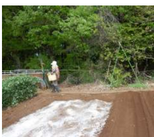
←04.25カカは耕す予定の畝の落ち葉などを片付け →片付けた赤大根畝に白菜畝と葉物畝などを耕し、夏野菜の準備。