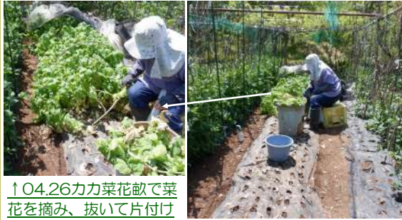
↑04.26カカ菜花畝で菜花を摘み、抜いて片付け