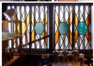
↑6月12日「アンティーク冬 花」へ行った。山梨県北杜市須 玉町若神子1701-2・中央高 速道 須玉IC近くの国道141号 線 信号「岩根橋東」脇にあ る。気さくな店主夫妻と安価な 品が魅力。毎月の営業予定日 10日～20日(水曜日休業)