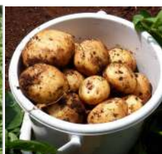
→06.13手探りで大 きなジャガイモだけ を試し掘りした。 →06.21家族が掘っ た後の夕方、カカト でジャガイモ掘る