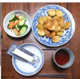
↑06.26「ジャガイモ小芋の味 噌転がし」ジャガイモはキタ アカリ、キュウリの浅漬け、タ ンパク質に裂けるチーズ、ほう じ茶そえた風食。