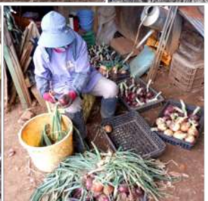
←06.07 玉ネギを選 別し茎を切 り、切り口 が乾いてか ら →種類別 にネットに 入れ吊り保 存。