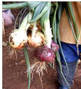
05.21← 玉ネギ試 し掘り? 出来はマ ズマズ!! →06.06 赤玉ネギ 出来良く 玉ネギは 出来悪い

コンニャク芋を作り続けていたが、宿の廃業とカカトも歳老い、さらに芋からコンニャクを手作りする知人も減り、芋を処分し減らさなくては・・・どうするカカ様??。