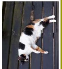
06.07バルコニー で風寝 ハナ

「梅は三 毒を断 つ」「一 日一粒で 医者いら ず」「梅 はその 日の難 逃れ」