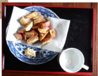
↑06.14十時のお八、アンデ スレッド小芋の素揚げと牛乳。