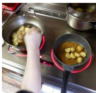
↑ジャガイモ小芋を素揚げして

6月はジャガイモの収穫月、掘れば出てくる小芋コロコロ。小芋は素揚げや味噌転がしにする。手頃な大きさの芋は保存し、来年の収穫時期まで食べつなく。