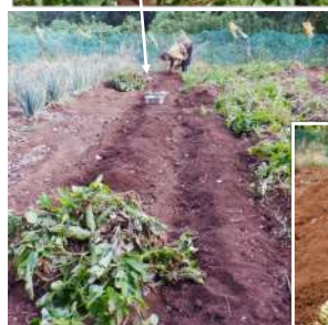
→06.22家族用にキタ アカリ1畝を残して掘り終 わるジャガイモ出来良し!