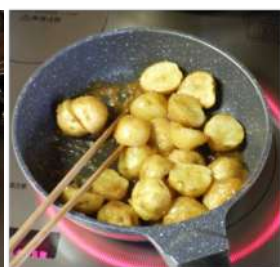
↑素揚げした小芋を、味 噌と砂糖に味噌のタレにか らめて出来上がり。