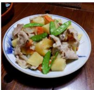
←06.16夕食に肉ジャガ、豚 肉・人参・絹サヤとホクホク ジャガイモのキタアカリ。