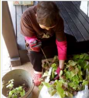
04.26/玄関土間で芽出しさせた安納芋苗 ↓芋の発芽を見て芋を切り分け苗作り