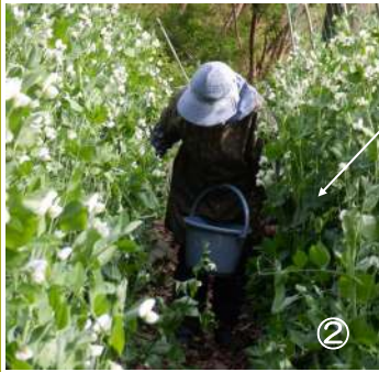
②04.22ツルも160cm程に伸びスナップエンドウの収穫始まる