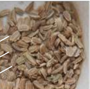
←↑04.13人参種の大きさ形は平べったく爪の間に入る種をカ力三列トト2列蒔いた。