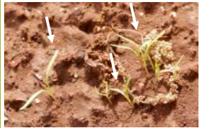
←04.26人参の発芽、ほぼ原寸大。これがあの大きさの人参に!! 生命力と土の力に驚き!!