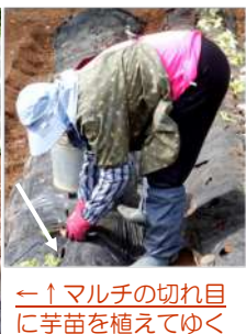
←↑マルチの切れ目に芋苗を植えてゆく