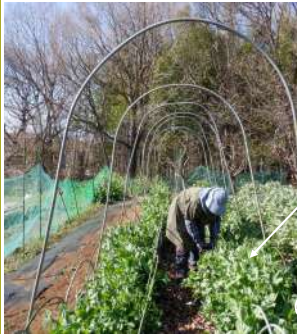
①04.03スナップエンドウ2畝にツル豆誘引ネットを張り柵作り