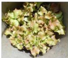
04.20↑家で育てたサニーレタス苗を畑に運び一畑に移植、その後も日を分けて移植中。