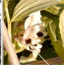
↑空豆は白花に黒丸の模様がある、西日なので緑色が黄色に。カ力は空豆莖の転倒防止作業