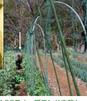
04.06スナップエンドウ畝と空豆畝の隣、グリーンピース畝にも柵作り、誘引ネットも張った。