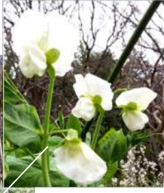
↑04.05スナップエンドウの白花、グリーンピースの花は一回り大きい