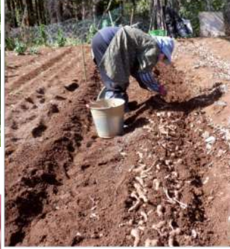
04.11家で保存してあったゲンコツ芋を植えた。4月28日まで発芽はしていない。発芽したらトンネル支柱を立て、芋ツルを誘引させる。

四月下旬は夏野菜への切り替え時期、種蒔きや苗植えなどで忙しくなるが、その前に肥料を買い、冬野菜を片付け空いた区画から耕運機で耕し、野菜の種類に合わせて畝作り、その畝に合ったマルチを張る。ツル豆はパイプなどで柵作りをしたり、その合間に草取りもする。